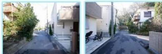
南側が行き止まりなので車の通行が少なく安全です！