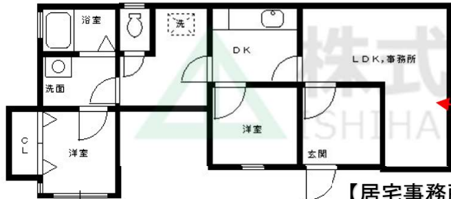
【居宅事務所詳細図】