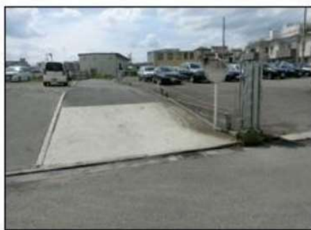
↑ 私道につき通行承諾済です。