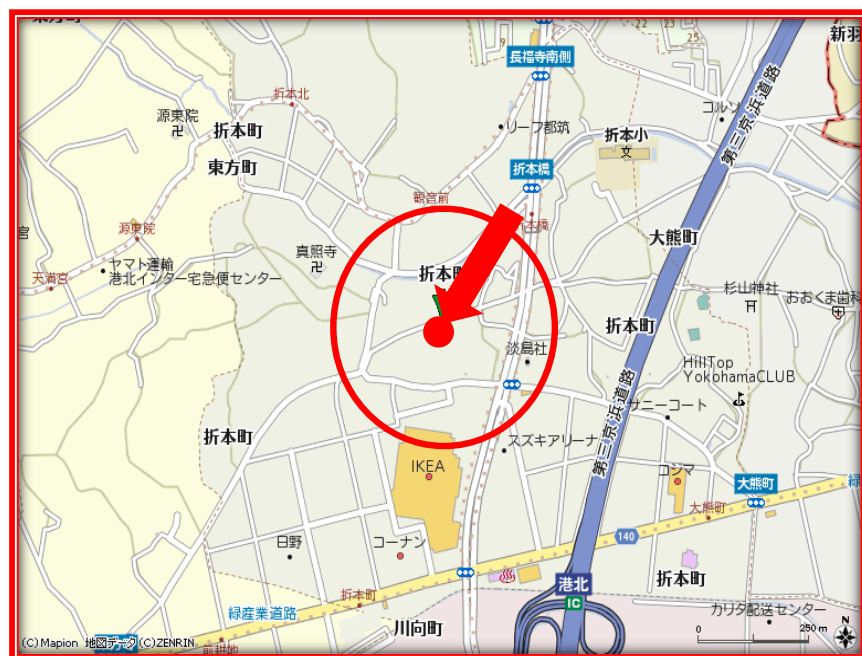
§ 配置PLAN §