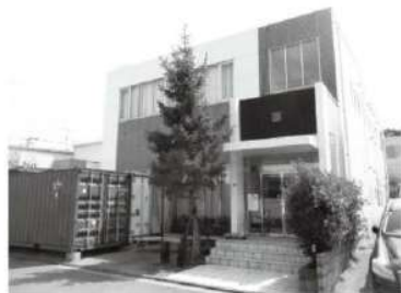
(物件正面外観・コンテナは有りません)