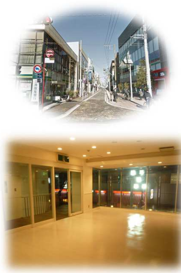
〈参考:スケルトン時〉