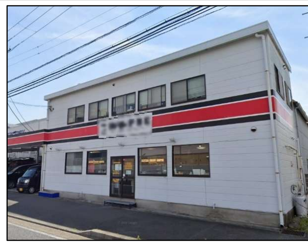
※道路側 1階2階事務所部分解体予定